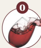
O SCHWEFELDIOXID UND SULFITE

Senfpulver, Senföl, Senfsa- men, Senfsprossen