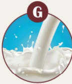
G MILCH VON SÄUGETIEREN UND MILCHERZEUGNISSE (inklusive Laktose)

Sojasprossen, Sojabohnen, Edamame, Miso, Sojapaste, Sojasauce, Sojajöl, Sojapul- ver, Sojalecithin, Tofu