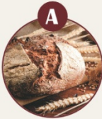
A GLUTENHALTIGES GETREIDE